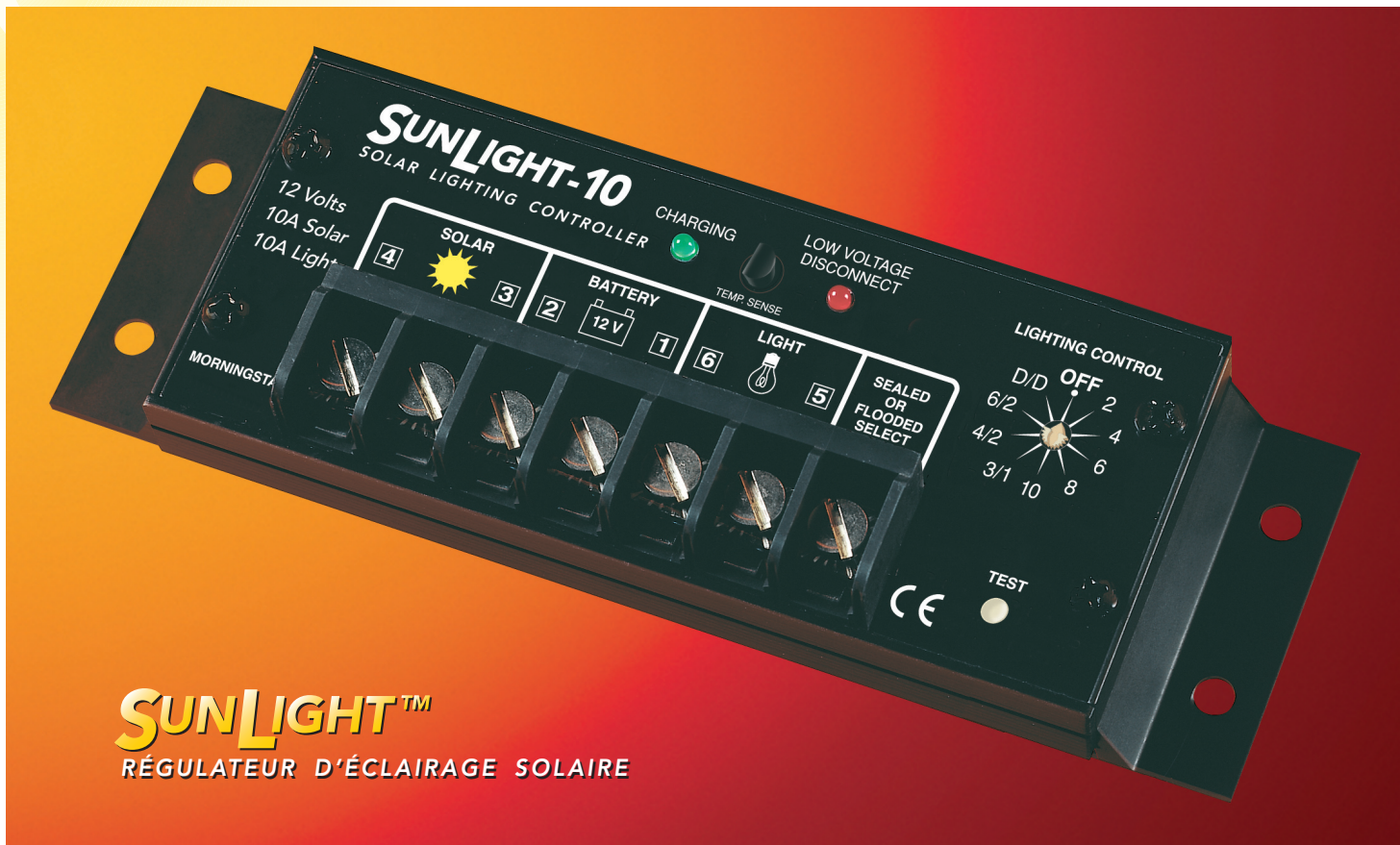
SUNLIGHT™ RÉGULATEUR D'ÉCLAIRAGE SOLAIRE

Le régulateur d'éclairage SunLight Morningstar d'avant-garde combine la conception SunSaver à un microcontrôleur pour l'exécution des fonctions de commande d'éclairage automatique.